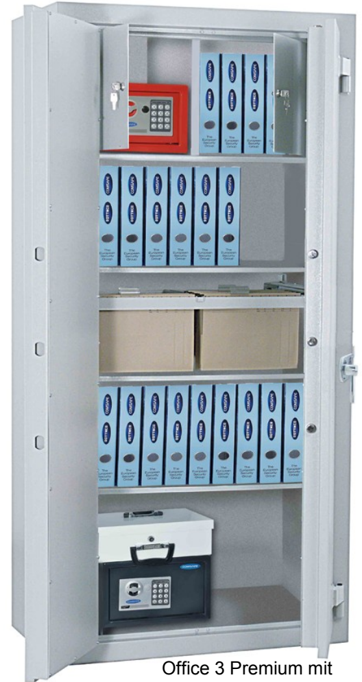
Office 3 Premium mit Sonderausstattung